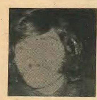
Εδουλέβικες προηγουμένως τζιαι έπαινεσε 30 λίρες την εβδομάδα. Τωρα πιάνεσ 9-10 τζιαι βουεις τζιαι το φόβο αν κάμεις κατι να σε δικαζω, τζιαι να πιέση άλλον. Πρέτει οι εργατες τζιαι οι πρόσφυγες να εννοθούν τζιαι μη να αγωνιστούν για να άνοιουν δουλειές τζιαι να αυξηθούν τα μεροκάματα.